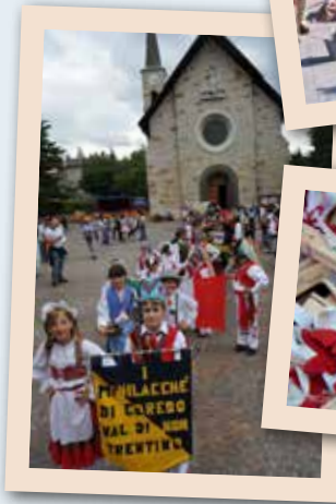
2011 Coredo - Minilacchè