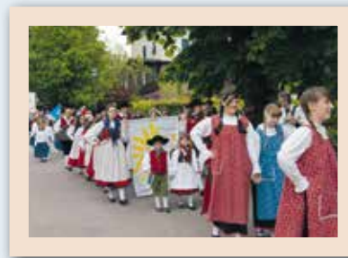
2013 Cavalese - Piccoli del Salvanel