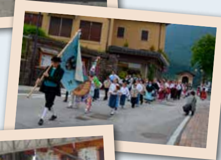
2015 Baselga di Piné Minicoro La Valle