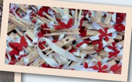
2012 Caderzone Pinzolo Folk Caderzone