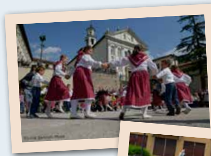
2014 San Michele Museo Usi e Costumi