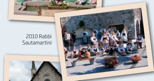
2010 Rabbi Sautamartini